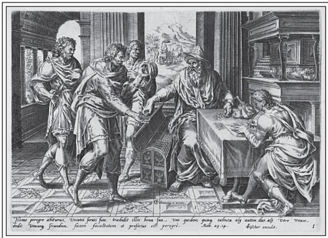
[La parábola de los talentos]

Cuando pensamos en nuestros talentos y en cómo debemos emplearlos, no consideramos nuestra riqueza financiera como un talento. Nuestros talentos son más personales que un simple cálculo de valor neto. Son los dones que nos hacen especiales y las habilidades que desarrollamos con el tiempo. En todo caso, si existe un vínculo entre el dinero y los talentos en