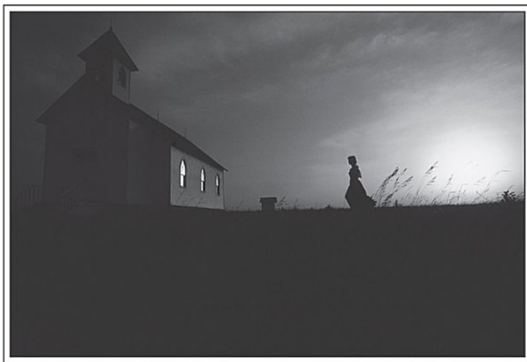
[vieja iglesia de Dane]

En este capítulo final me gustaría hacer una breve reflexión sobre los vínculos entre las finanzas y nuestra vida cotidiana, y plantear una pregunta un tanto diferente. Si las ideas financieras son tan nobles como las he esbozado, ¿por qué la percepción de las finanzas en el mundo tiende a ser tan unidimensional y negativa? O aún más, si las ideas financieras