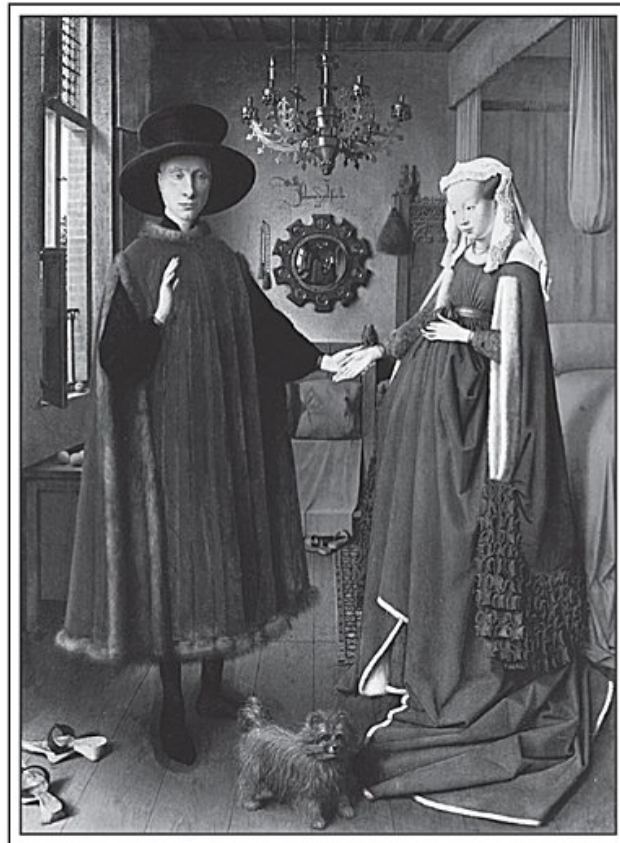
[El matrimonio Arnolfini]

Para ver uno de los retratos cinematográficos más auténticos de Wall Street, creo que hay que ir mucho antes de La gran apuesta y El lobo de Wall Street .