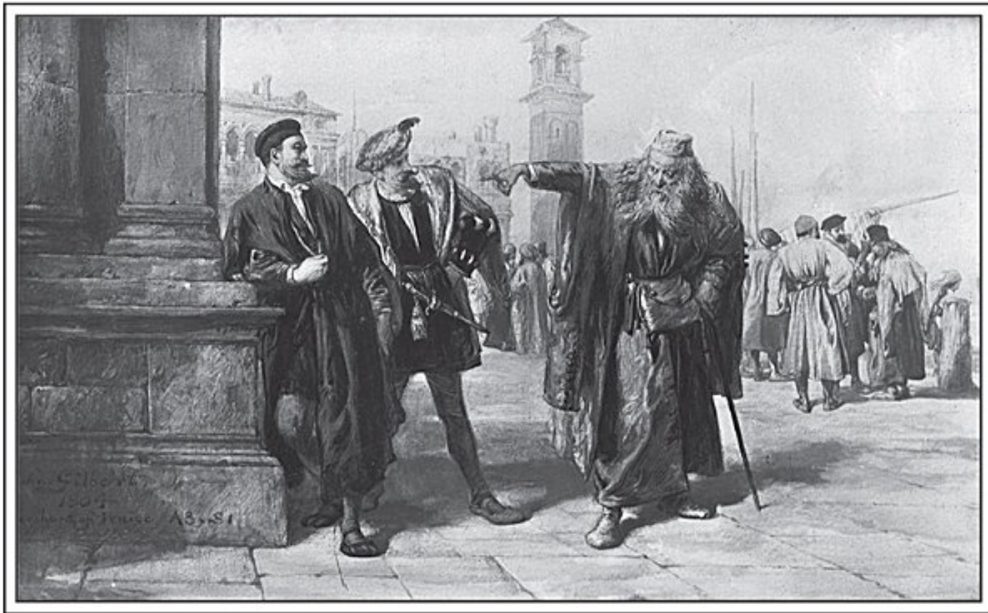
[El mercader de Venecia]

Las reuniones pueden resultar soporíferas, pero es probable que la reunión de profesores del 12 de julio de 2013 en el University College de Londres haya roto todos los récords. A un profesor lo condujeron a la reunión desde su lugar habitual al final del pasillo y lo sentaron al lado del rector saliente, no dijo una palabra y se consideró que estuvo «presente, pero sin voto». Si bien eso puede sonar común (o ideal, dependiendo de tu opinión sobre las reuniones), este profesor en particular había estado muerto durante cerca de doscientos años, y fue su esqueleto en preservación,