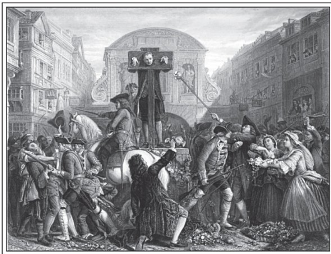
[Daniel Defoe en la picota]

En 1789, George Washington se dispuso a formar un gabinete que le ayudaría a tener una base más sólida a la nueva e inestable nación. Era consciente de las severas dificultades financieras que enfrentaba el país, por lo que creó un Departamento del Tesoro. Dada la complicada situación fiscal, la elección del primer secretario del Tesoro sería trascendental. Por